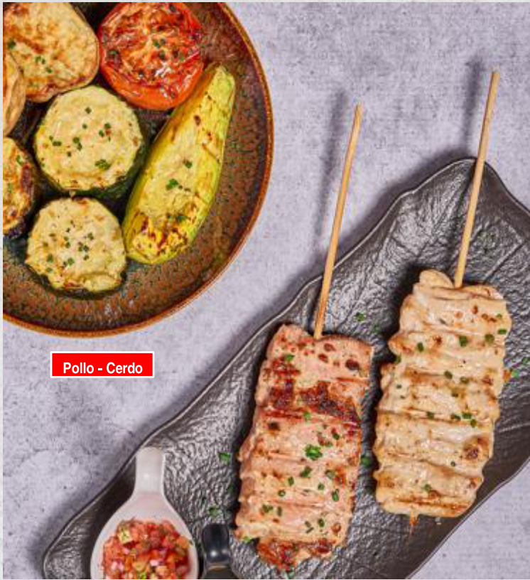
Pollo - Cerdo

Los Sticks de tu preferencia acompañados de vegetales a la parrilla.