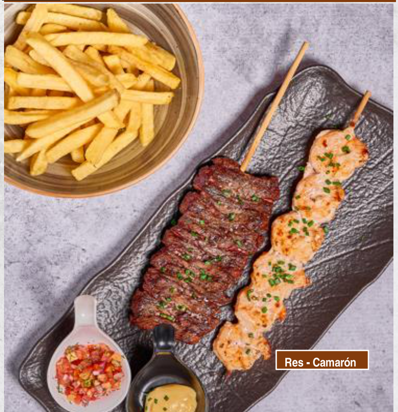
Res - Camarón