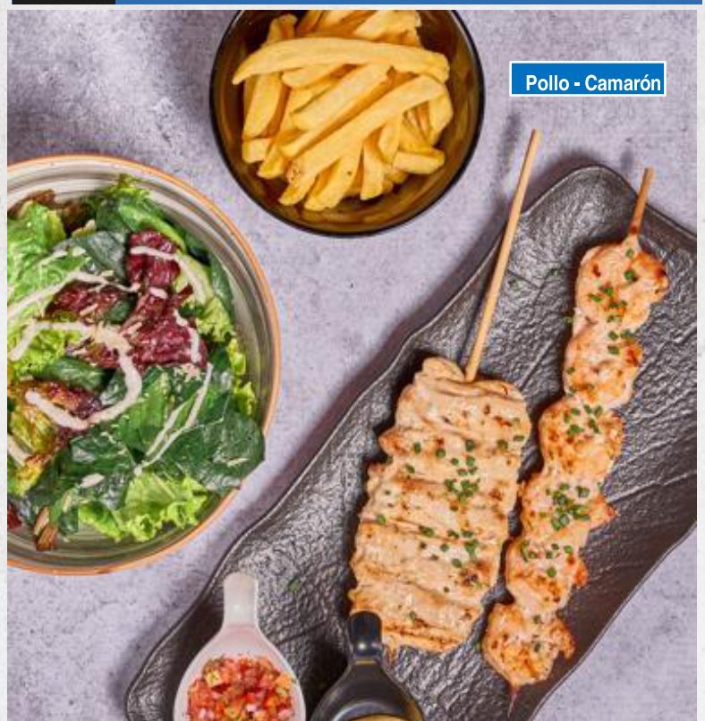
Pollo - Camarón