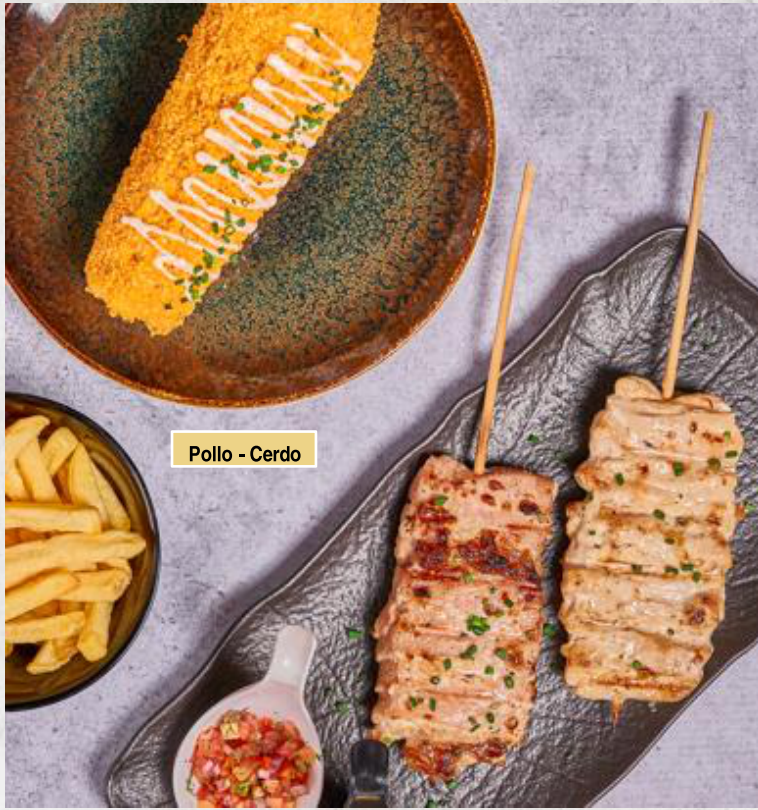
Pollo - Cerdo

Tus Sticks favoritos acompañados de mazorca crispy y papas a la francesa.